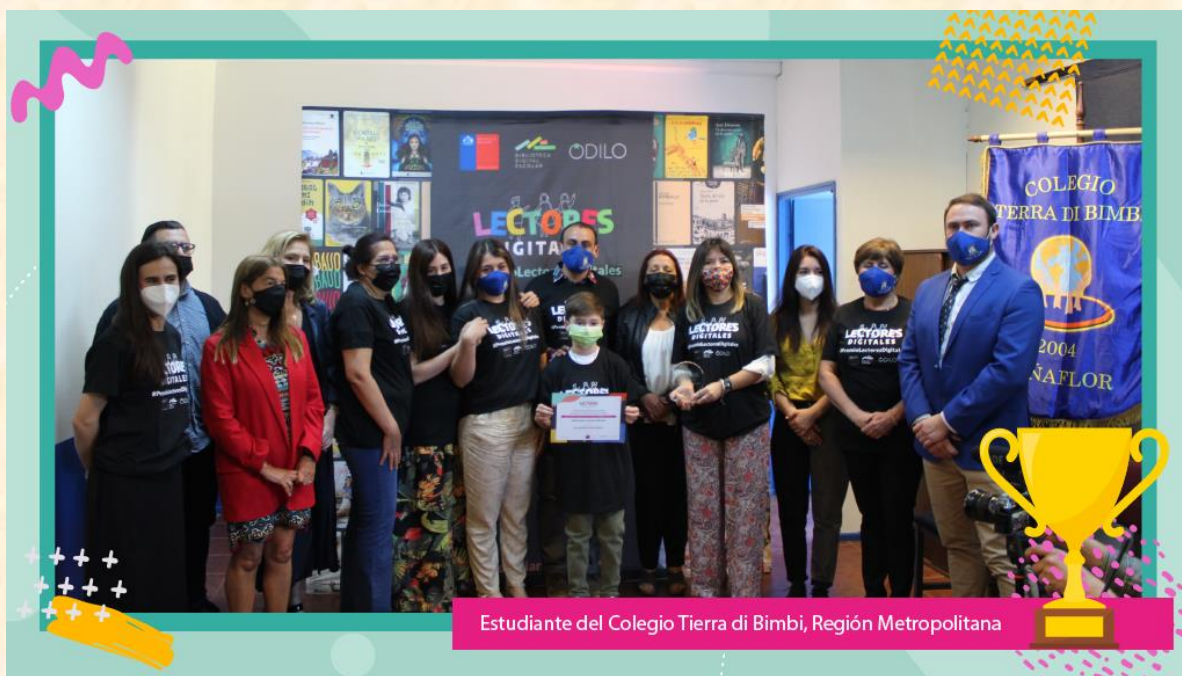
Estudiante del Colegio Tierra di Bimbi, Región Metropolitana

Para inscribirse, ingresar aquí , indicando el día del evento.