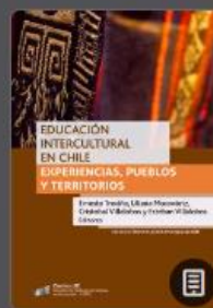
Educación intercultural en Chile: Experiencias, pueblos y territorios

EQUIPO CENTRO DE LECTURA Y BIBLIOTECAS ESCOLARES (CRA)