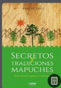
Secretos y tradiciones Mapuches