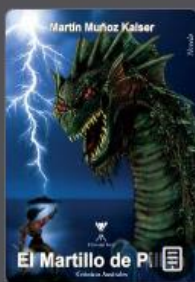
El martillo de Pillán