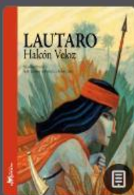
Lautaro, Halcón Veloz

Busca, elige y descarga lecturas en la sección Pueblos originarios aquí .