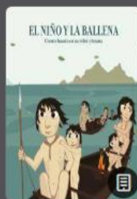
El niño y la ballena