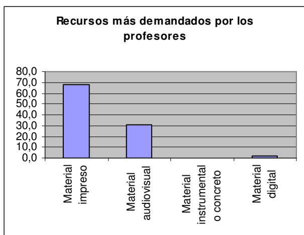
Cuadro 5.11. Recursos más demandados por profesores.

Solo en el caso del equipo directivo, aparece con un porcentaje destacable de mención otro material el digital, que alcanza el 16.5% del total de menciones válidas. Es en el caso de este público principalmente donde las diferencias entre las menciones de utilización de materiales son más pequeñas. En el caso de los alumnos, el resto de los materiales prácticamente no aparecen como los más solicitados.