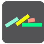
Biblioteca Digital Escolar

Para Android está disponible mediante Play Store y para IOS en App Store, digitando biblioteca digital escolar . Aparecerá el ícono: